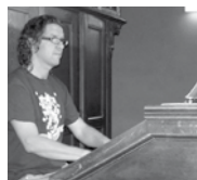
Direcció: Tomé Olives